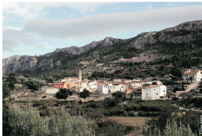
Benialí, la Vall de la Gallinera